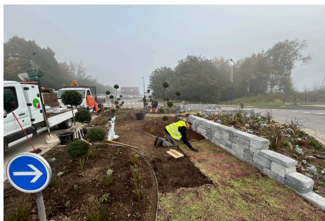
Aménagement du giratoire rue de Domèvre.

Dans le prolongement de ses actions pour l'entretien et l'embellissement du cadre de vie, la Ville engage de nouveaux travaux d'aménagement.