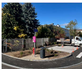
Aménagement des espaces verts autour de la nouvelle médiathèque.